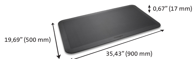
Esterilla antifatiga K55401WW

Innovación, calidad y confianza son los factores que han hecho de Kensington® The Professionals' Choice™ en accesorios ergonómicos durante más de 20 años.