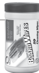
BoardWipes Dry-Erase Cleaning Wipes

ACCO Brands (Returns Center) 101 Bolton Ave SE Booneville, MS 38829 USA Tel: 800-541-0094 www.acco.com www.quartet.com