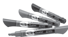
EnduraGlide Dry-Erase Markers

Look for these high-performance accessories from Quartet®