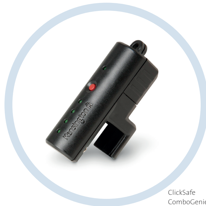
ClickSafe ComboGenie met mastercode

OPLOSSINGEN VOOR EEN SLIMMERE WERKOMGEVING