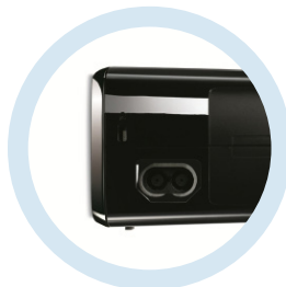
Consolas de juegos