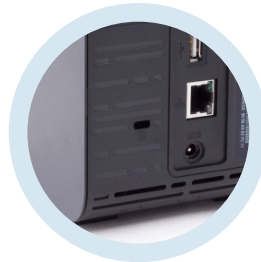
Unidades de discos duros