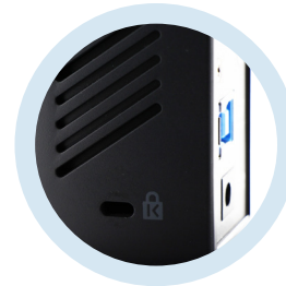
Replicadores de puertos