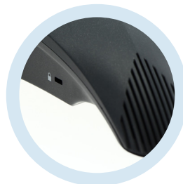
Teléfonos de conferencias