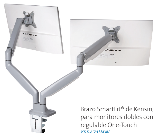
Brazo SmartFit® de Kensington para monitores dobles con altura regulable One-Touch K55471WW

Las investigaciones confirman que una estación de trabajo diseñada ergonómicamente brinda beneficios de bienestar y productividad que vinculan la adopción de una postura correcta con mejor asistencia al trabajo y mayor actividad de los empleados. Solo algunas de las maneras en las que el brazo SmartFit® de Kensington para monitores dobles con altura regulable One-Touch favorece el bienestar de los empleados: mejora la postura, favorece la alineación de los ojos correcta y brinda comodidad en el cuello y los hombros.