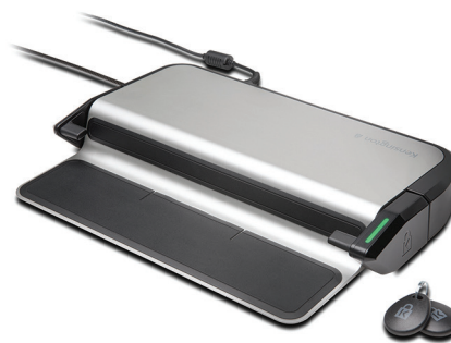
LD5400T 多用户 Thunderbolt 3 扩展坞 (带 K-Fob™ 智能防盗锁) K39470M