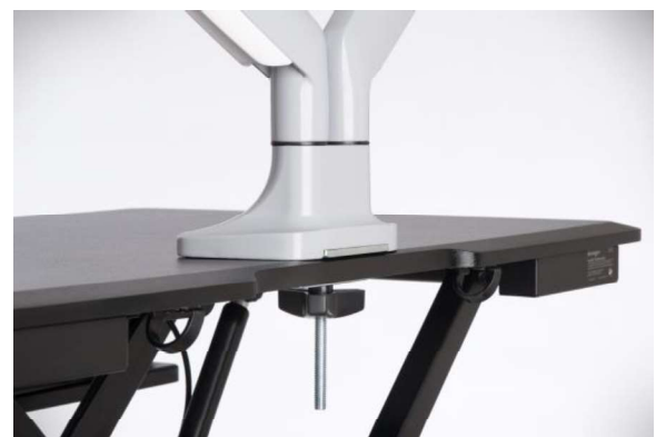
Installation mit Gewindeschraube (Tülle)