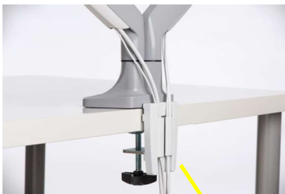
Installation mit C-Klemme