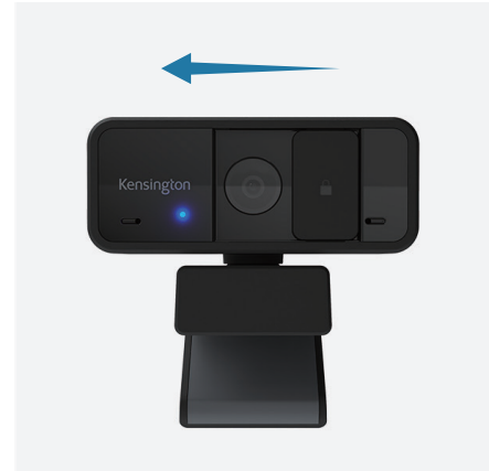
Image vidéo large avec couvre-lentille

La lentille de verre à mise au point fixe stabilise la mise au point, et ce, même dans les environnements à faible luminosité ou à contraste prononcé. Ajustable manuellement jusqu'à 37° à la verticale et 360° à l'horizontale pour profiter des meilleurs angles de caméra.